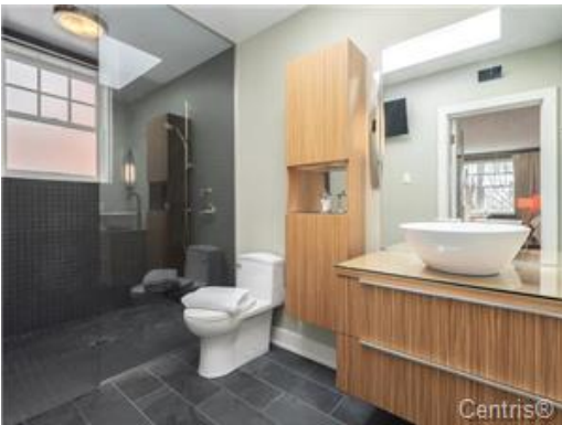
Salle de bains attenante à la CCP