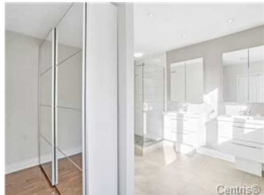
Salle de bains attenante à la CCP