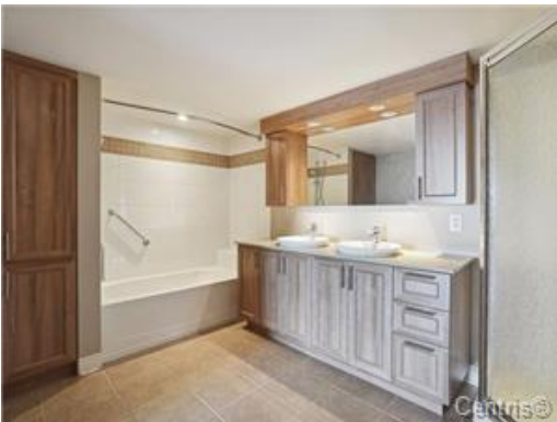
Salle de bains attenante à la CCP