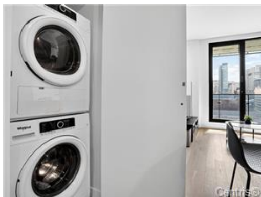
Salle de lavage