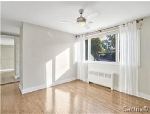
Chambre à coucher principale