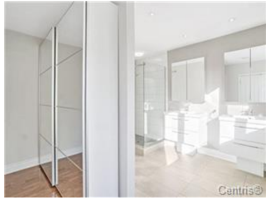
Salle de bains attenante à la CCP