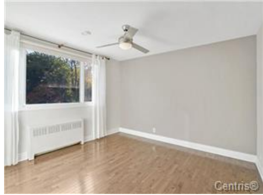
Chambre à coucher principale